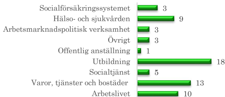
Figur 2. Totalt antal ärenden fördelade i samhällsområde

Likt föregående år dominerar anmälningar på utbildningsområdet. Anmälningarna är riktade mot alla typer av utbildningsanordnare, från förskola till gymnasieutbildningar och universitet. Dessa avser oftast avstängning från skolan och huvudmännens underlåtenhet att utreda och åtgärda vid kännedom om kränkande behandling/trakasserier men även skolans regler och förhållningsätt gällande utövning av religion på skolans område. Ärenden rörande tjänster och bostäder handlar om diskriminering vid tillhandahållande av vissa tjänster såsom färdtjänst samt rutiner vid uthyrning av bostad. Anmälningar hälso och sjukvård omfattar rätten att ta del av vård och behandling. Orsak till anmälningar mot arbetsgivare rör framförallt avsked och trakasserier. Med socialtjänst menas verksamhet som omfattas av socialtjänstlagen och anslutande lagstiftning. Exempel på sådana anmälningar är handläggning av ärenden gällande utredningsrutiner vid familjehemsplacering och umgängesrätt.