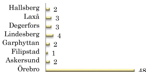
Figur 4. Ärenden uppdelade i geografiskt område

Vid en uppdelning av de inkomna individärendena går det att utläsa att hela 48 av de 65 kommer från Örebro kommun.