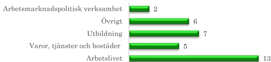
Figur 2. Totalt antal ärenden fördelade i samhällsområde

I kategorin övrigt ingår ärenden som inte omfattas av diskrimineringsförbudet. Ärenden behandlar exempelvis nedsättande uttalande i radio och tidningar samt nekande av föreningsmedlemskap. Arbetsmarknadspolitisk verksamhet omfattar utbildningsföretag som finansieras med offentliga medel. Ärenden handlar om nekande till yrkesutbildningar med hänvisning till religion och etnisk tillhörighet.