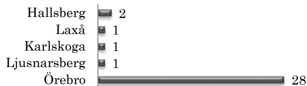
Figur 4. Ärenden uppdelade i geografiskt område

Vid en uppdelning av de inkomna initiativärendena går det att utläsa att hela 28 av de 33 kommer från Örebro kommun.